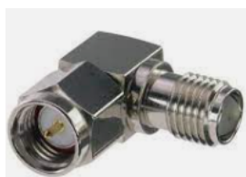
Adapter SMA-Winkeladapter Best.Nr. SMA/St-Kpl