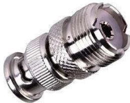
Adapter PL-Kupplung ⇔ BNC-Stecker Best.Nr. BNC-St/PL-KPL