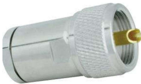
Stecker_PL-St. Best.Nr. PL-St AC7