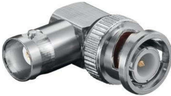
Stecker_BNC-Winkel-Adapter Best.Nr. BNC-St/BNC-KPL WKL