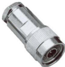
N-Stecker, lötfähig Best.Nr. N-ST/213