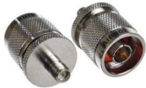
Adapter N-Stecker ↔ SMA-Kupplung Best.Nr. SMA-KPL/N-ST