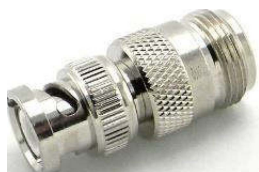
Adapter N-Kupplung ⇔ BNC-Stecker Best.Nr. BNC-St/N-KPL