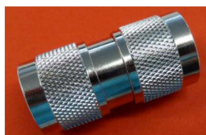
Koaxadapter N-Stecker <=> N-Stecker Best.Nr. N/St-St