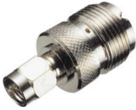
Adapter PL-Kupplung ↔ SMA-Stecker Best.Nr. PL-KPL/SMA-ST