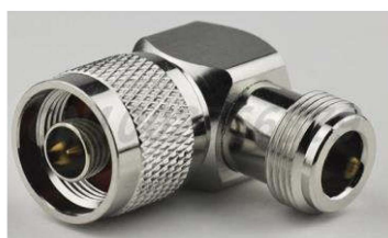
N-Winkeladapter Best.Nr. N/WKL