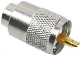
PL-Stecker Best.Nr. PL-St/AC5