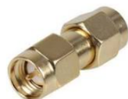
Adapter SMA-Stecker<=> SMA-Stecker Best.Nr. SMA/St-St