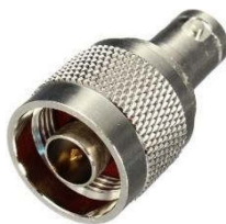
Adapter BNC-Kupplung ⇔ N-Stecker Best.Nr. BNC-KPL/N-ST