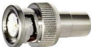
BNC-1523 BNC-Stecker => Cinch-Kupplung