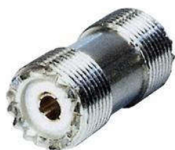
PL-Verbinder (Kupplung-Kupplung) Best.Nr. PL/KPL-KPL