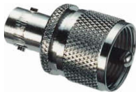
Adapter BNC-Kupplung ⇔ PL-Stecker Best.Nr. BNC-KPL/PL-ST