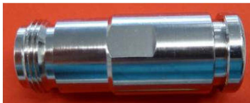
N-Buchse Best.Nr. N-KPL/AC7