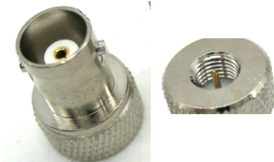
Adapter BNC-Kupplung ↔ SMA-Stecker Best.Nr. SMA-St/BNC-KPL