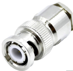
BNC-Stecker Best.Nr. BNC-St/AC7