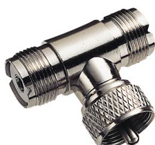
PL-T-Stück Best.Nr. PL-T-Stück