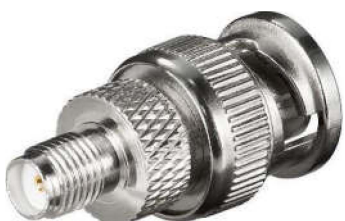
SMA-174 BNC BNC-Stecker <=> SMA-Kupplung