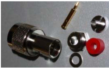
N-Stecker Best.Nr. N-St/AC5