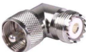
PL-Winkeladapter Best.Nr. PL/WKL