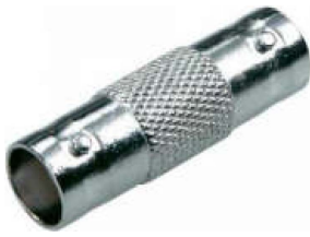
BNC-Verbinder Best.Nr. BNC/KPL-KPL