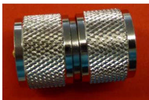
Koaxadapter PL-Stecker <=> PL-Stecker Best.Nr. PL/St-St