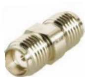
Adapter SMA-Kupplung <=> SMA-Kupplung Best.Nr. SMA/Kpl-Kpl