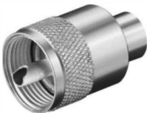
PL-Stecker Best.Nr. PL-ST/58