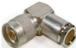
N-Winkelstecker, lötfähig Best.Nr. N-W-ST/213