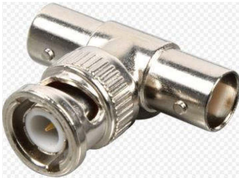
BNC T-Stück BNC T-Stück Bu/St/Bu