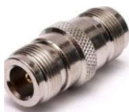
N-Verbinder N-Kupplung-N-Kupplung Best.Nr. N/KPL-KPL