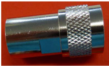
N-Stecker Best.Nr. N-St/AC7