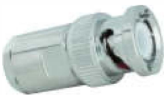
Stecker_BNC-Stecker Best.Nr. BNC-St/AC5