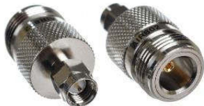
Adapter N-Kupplung ↔ SMA-Stecker Best.Nr. SMA-St/N-KPL