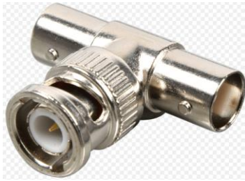
BNC T-Stück BNC T-Stück Bu/St/Bu