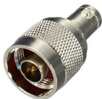
Adapter BNC-Kupplung ↔ N-Stecker Best.Nr. BNC-KPL/N-ST