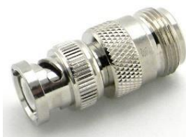
Adapter N-Kupplung ↔ BNC-Stecker Best.Nr. BNC-St/N-KPL