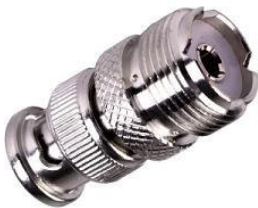
Adapter PL-Kupplung ↔ BNC-Stecker Best.Nr. BNC-St/PL-KPL