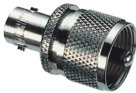
Adapter BNC-Kupplung ↔ PL-Stecker Best.Nr. BNC-KPL/PL-ST